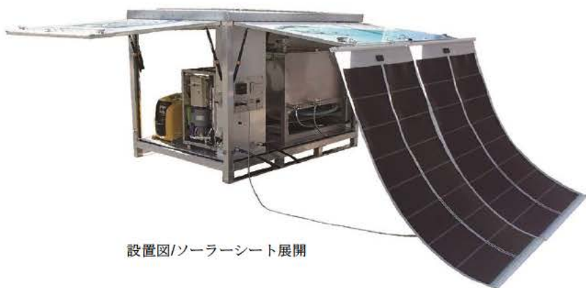
設置図/ソーラーシート展開