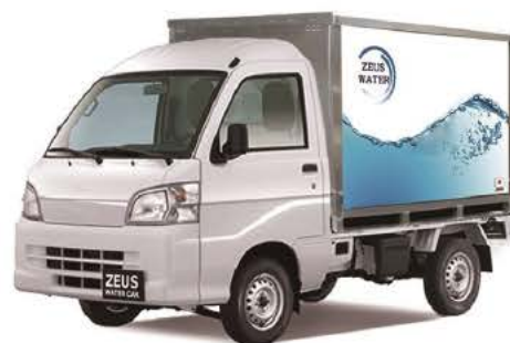
軽トラックで搬送可能