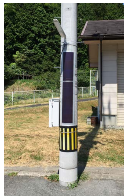
ストリートライトを電柱に巻いた例 （電柱使用には許可を得ています。）