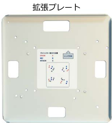
対応プロジェクター