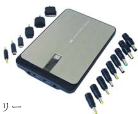
多彩なプラグを持つバッテリー