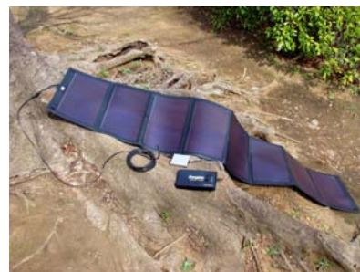
凹凸面でも設置が楽