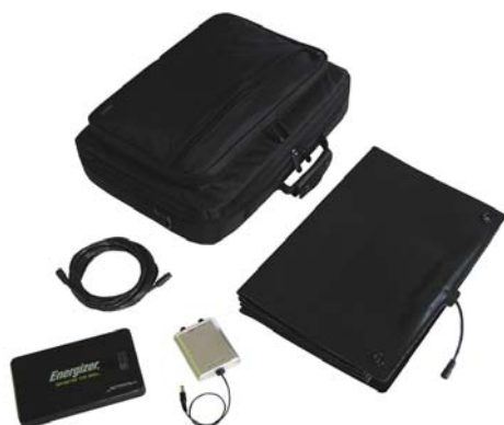
GSN-160B セット一式 ソーラーシートは 畳んだ状態