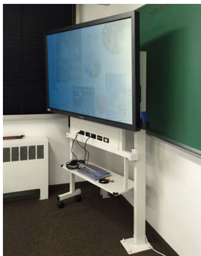
DT-100（使用例／右脚固定の場合）