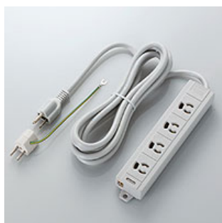
4口電源タップマグネット付 (D-D01)