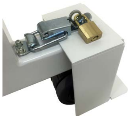
回転脚キャスターストッパー