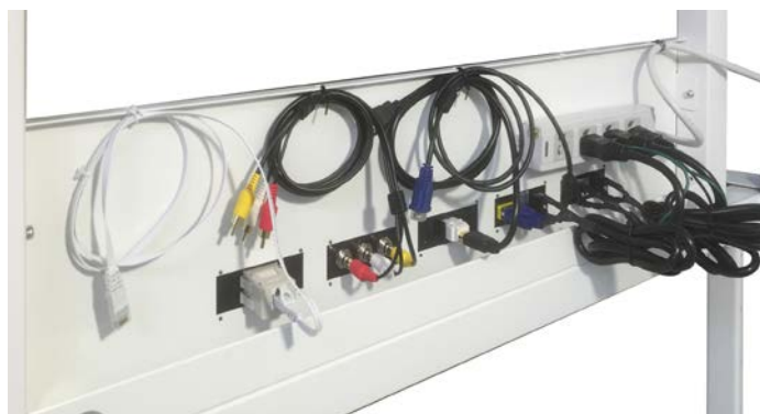
コネクターパネルと4口電源タップの使用例