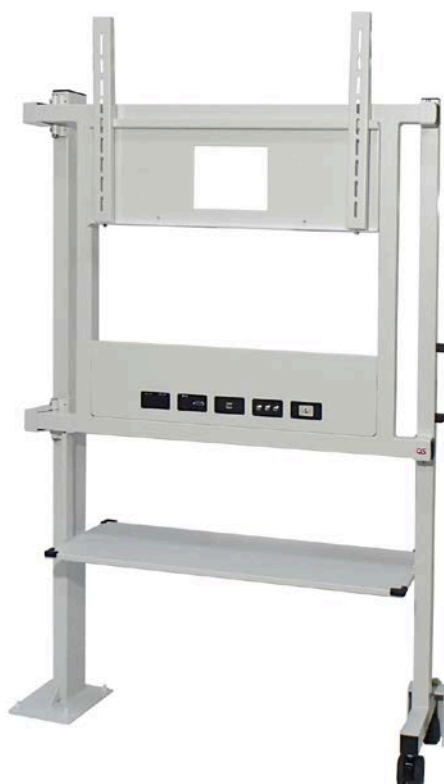
DT-100（左脚固定／オプション装着時）