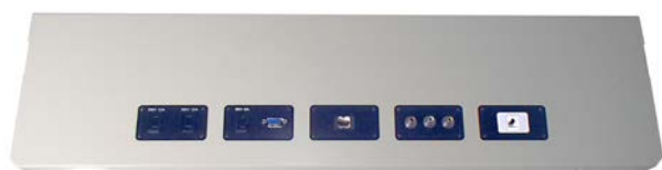
コントロールパネル (D-P01)