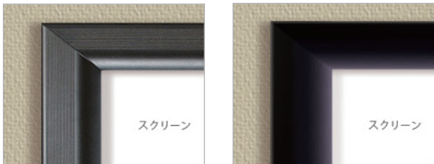
型式末尾-01 ブラック塗装フレーム 型式末尾-02 フロッキー加工フレーム