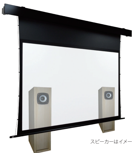
スピーカーはイメージです。