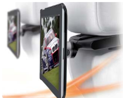
写真上：車のヘッドレストに