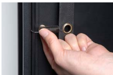
バネによる張り込み