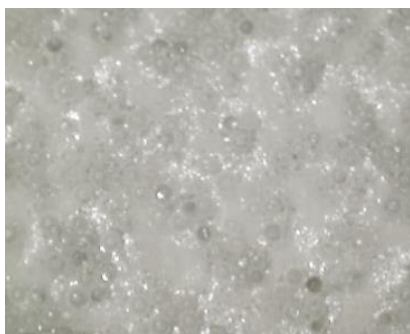
生地を顕微鏡で拡大