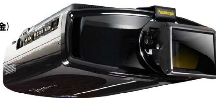
ビクタープロジェクターに取り付けた FVX200J