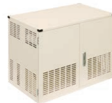
D-TC1-W ディスプレイスタンドに搭載 できる充電保管庫