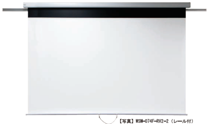
【写真】 WSM-074F-RV2-2 (レール付)