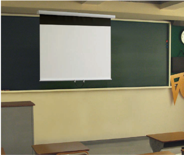
【写真】 WSM-068F-FV2-2 (レール無)

黒板に全面密着する安定感と平面性。 ソフトウインドとボールストップ機構を 備えたマグネット式スクリーン。