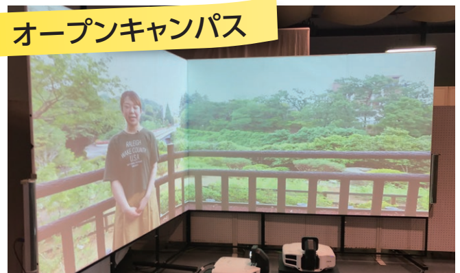
リアリティあふれるオープンキャンパス