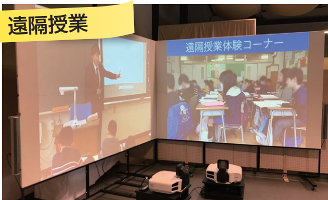
小規模学校と大規模学校をつなぐ遠隔授業