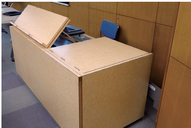
既設レクチャー卓