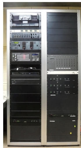
価格はずべてオープンです。

操作システムを見直し、タッチパネル操作に変更。不要な機材が入っていたラックは元々4連のものから2連へと変更。既存の音響設備はそのまま使用しつつ、スイッチャーなどの映像設備を主に更新しています。