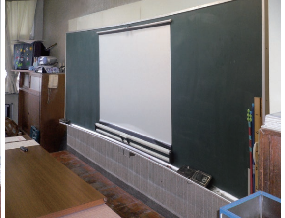
左:EEU-3612B1本体(黑板取付前) 上:曲面黑板取付時 弊社WSM-070WC-MV2 マグネット式スクリーン取付状態

平面・曲面黑板、ホワイトボードに適合。 装置本体が見えないので違和感も全くなし。