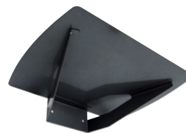
下方から見た棚板