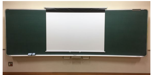
黑板上への収納状態。収納場所にも困りません。