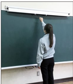
取手 (紐付き) を持って引き出します。