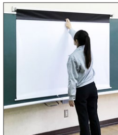
上部にふくらみができるので、上黒ジョイント部に沿って空気を押し出すように密着させます。