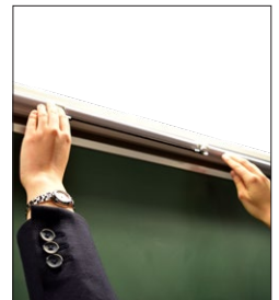
ケース収納後は取手の紐を左右に引き板書の邪魔にならないようにできます。