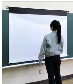
下まで引き出したら、ボールストップ機構でロックをかけて板面に密着させます。