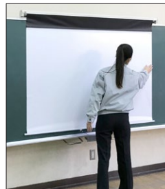
全体に浮きを確認し、設置完了です。