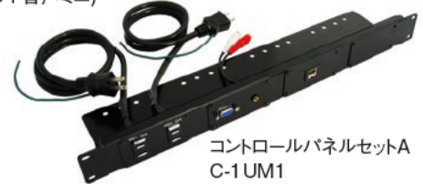
コントロールパネルセットA C-1UM1