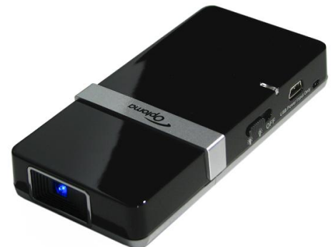
製品の外観は、実際と異なる場合があります。