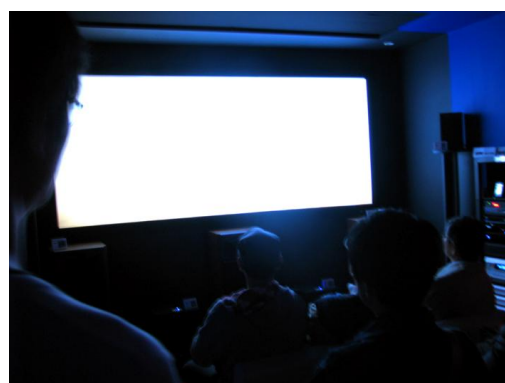
サンプル視聴会風景 (PA-120C-02 使用)