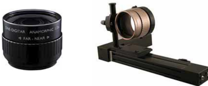
アナモフィックレンズ(左)と電動スライド架台(右) Schneider (独) 提供)

プロジェクターのフル画素を使用し、シネスコ画面をお楽しみいただくためには、アナモフィックレンズが必要です。通常ですと上下に黒オビが入ってしまうシネスコ映像を、プロジェクターの V ストレッチ機能を使用し、16:9 パネル一杯にシネスコ映像部分のみを縦方向に引き伸ばします。そして、アナモフィックレンズにより 2:35:1 のアスペクト比に変換し、投影することにより、プロジェクターの持つ最大画素を使用し、シネスコ映像を楽しむことができます。